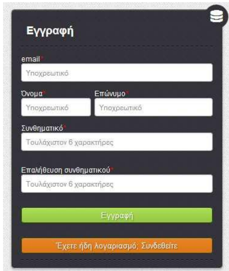
Εικόνα 2. Φόρμα εγγραφής στο σύστημα

Από την αρχική σελίδα, για να κάνουμε εγγραφή, θα πρέπει να επιλέξουμε το πορτοκαλί κουμπί με τίτλο «Εγγραφή στο σύστημα». Θα προκύψει η παρακάτω φόρμα: